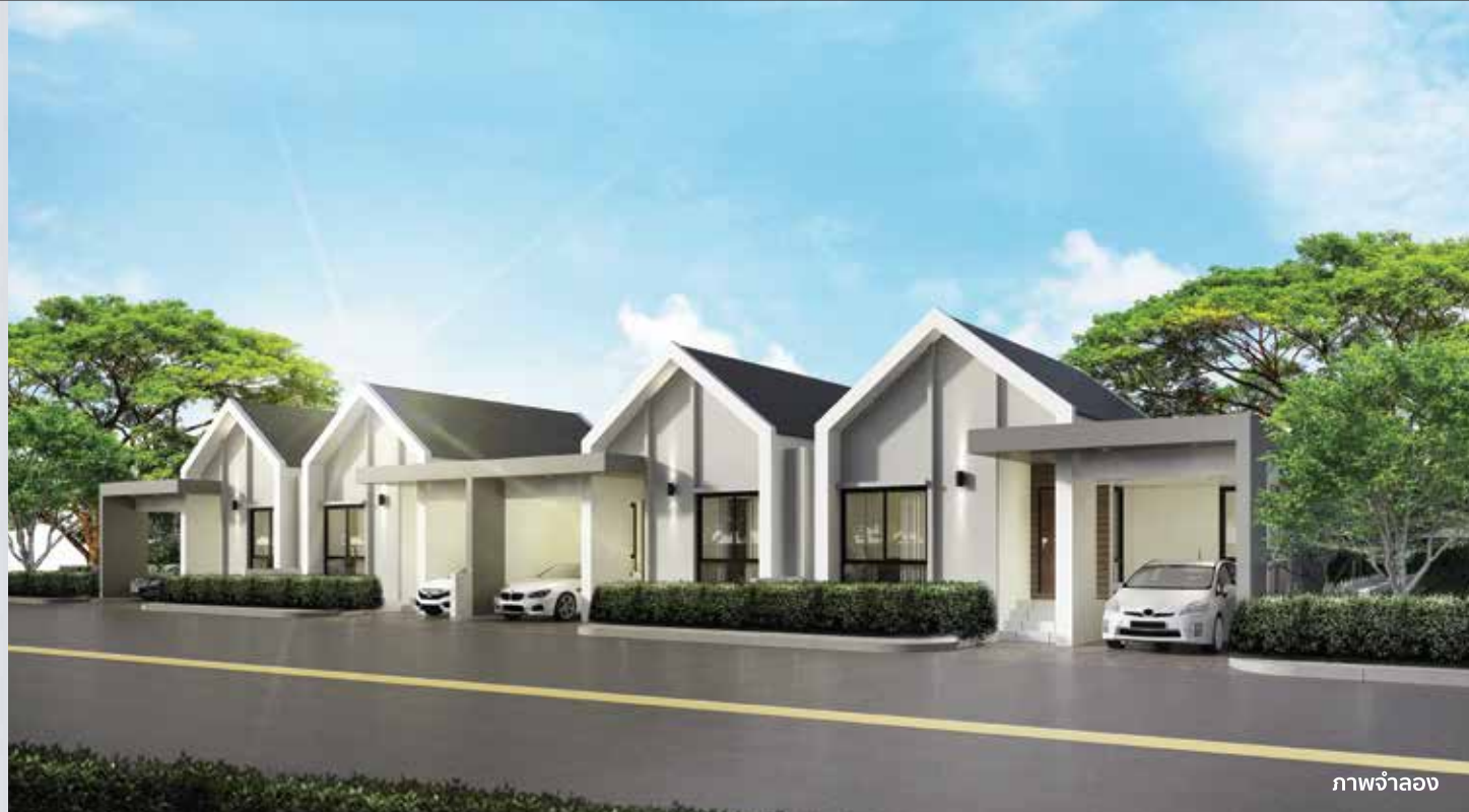
ภาพจำลอง