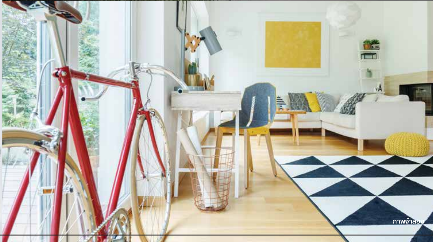
ภาพจำลอง